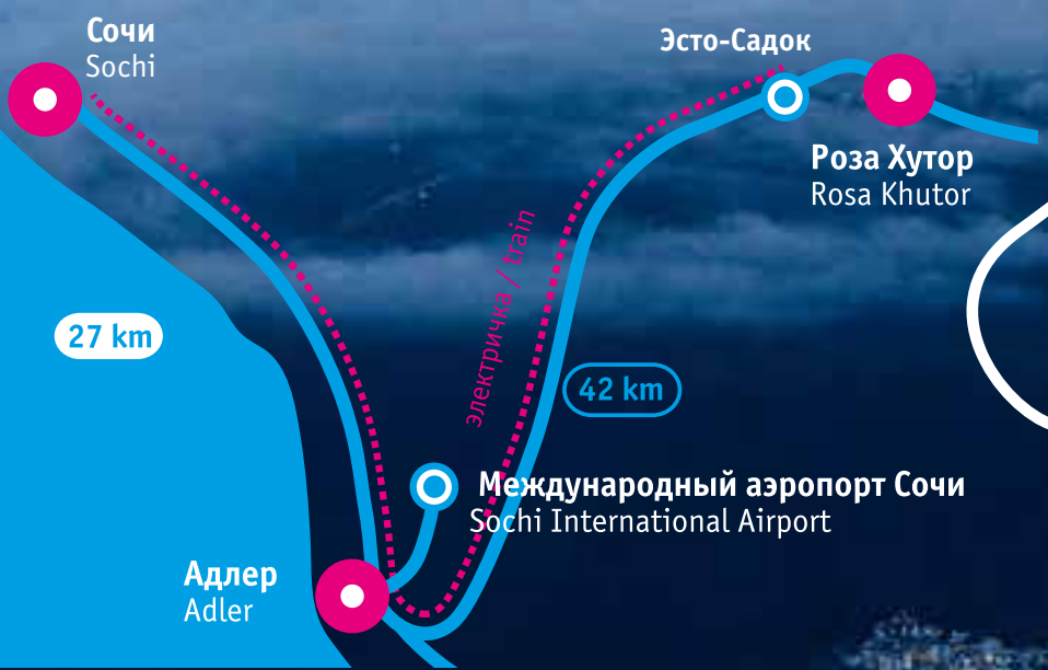
СХЕМА ПРОЕЗДА | ROUTE TO THE RESORT: