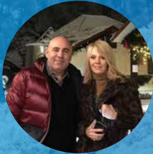
И.ПРИГОЖИН И ВАЛЕРИЯ